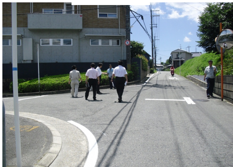
合同点検の実施状況