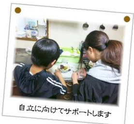
自立に向けてサポートします

来ていただいたお子さんに「楽しかった！」と言って帰ってもらえることが、この仕事をしていて一番嬉しい瞬間です。