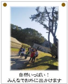
自然いっぱい！ みんなで外に出かけます

この度はご紹介いただきありがとうございます。私たちは株式会社サムアイズが経営する、放課後等デイサービス「みんなの家」です。田原地域の障がい児童の家族会の皆さまより、子どもが放課後の時間を過ごす場所がないという相談を受け、6年前に設立を決意し、現在に至ります。