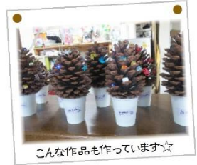
こんな作品も作っています☆

田原地域の中で、気持ちのバリアフリーを担えるよう、これからも楽しく過ごしやすい空間の中で、子どもたちが生き生き成長できる環境を作りたいと思っています。どうぞよろしくお願いたします。