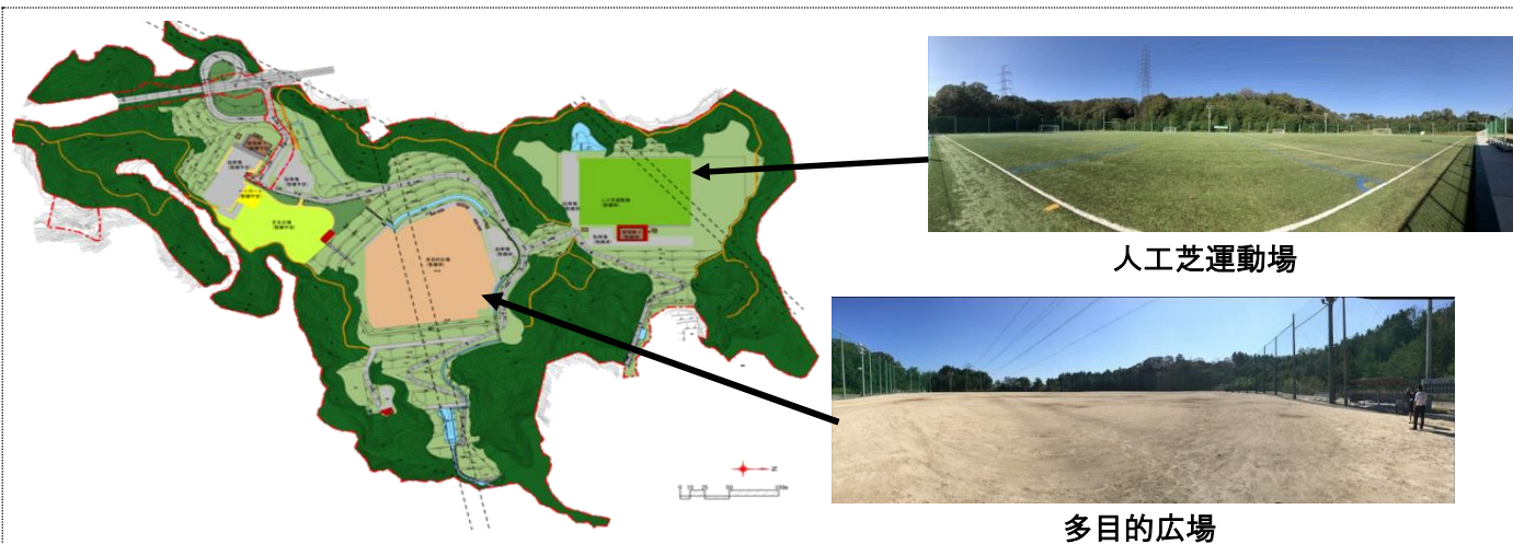
公園概要図（人工芝、多目的のみ供用）