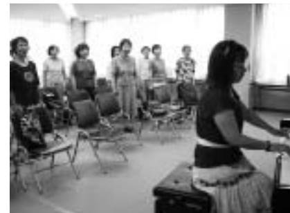
練習に励む合唱団「銀の鈴」