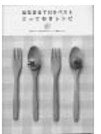
「はなまるTHEベスト とっておきレシピ」 ソニー・マガジンス

「お手伝いさんはスーパーバイ!」 赤川 次郎 「カンランシャ」 伊藤たかみ 「デンデラ」 佐藤 友哉 「中央線に乗っていた男」 西村京太郎 「道絶えずば、また」 松井今朝子 「宵山万華鏡」 森見登見彦 「最も遠い銀河 上・下」 白川 道 「半島へ、ふたたび」 蓮池 薫