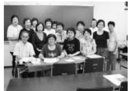
「ひかり書道会」のみなさん