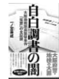
「白濁書の闇」 いしのかみしんじ 一ノ宮美成 宝島社