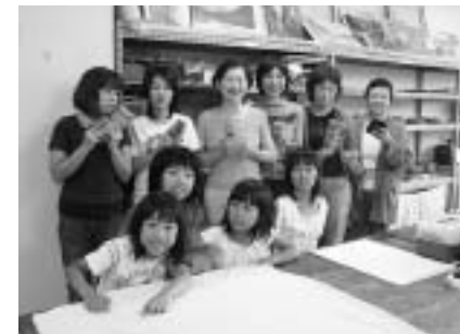
作品を手に「レザーアート」のみなさん