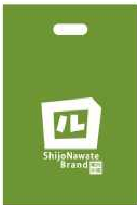
③手提げ穴あきポリ袋