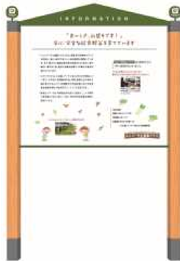
⑨四條畷ユニバーサル農園ハウス紹介サイン（盤面）