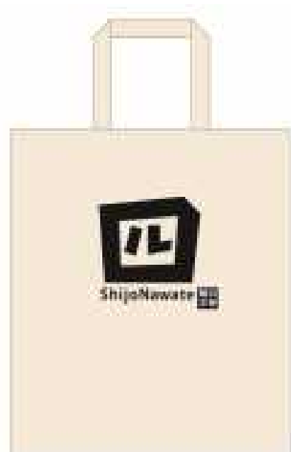
②エコ（コットン）バック