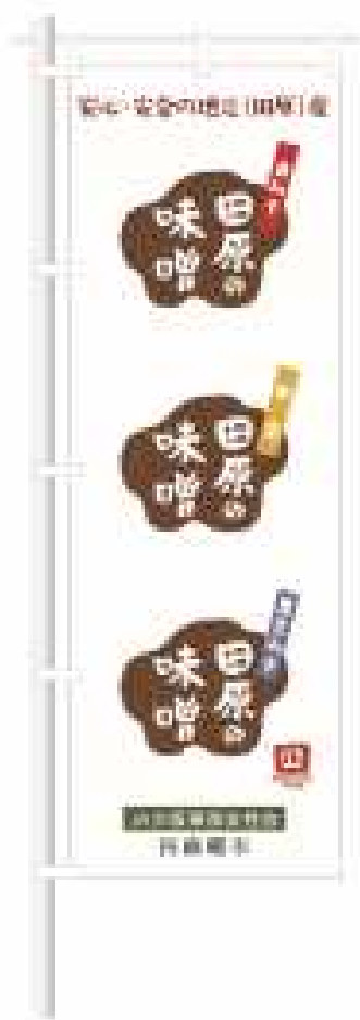
⑬田原の味噌のぼり