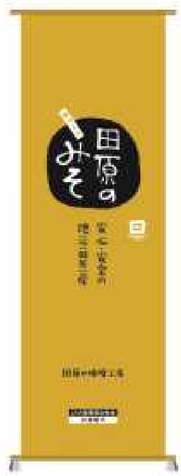
⑭味噌加工所日除けのれん