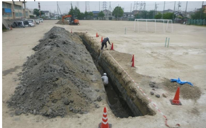
トレンチ掘削状況(トレンチ