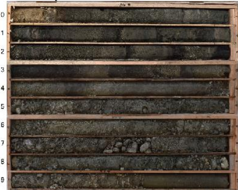
ボーリングコア写真 (m) (ボーリング No. 4)