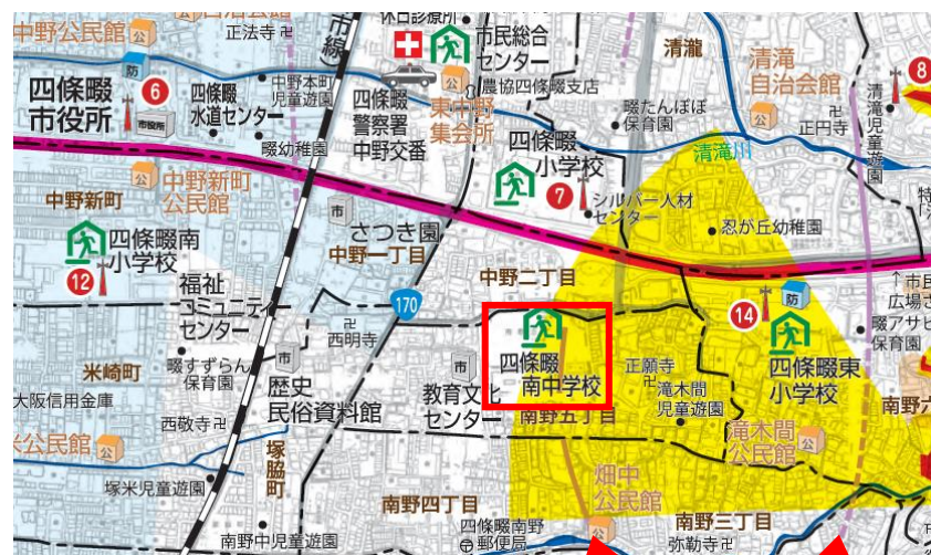
防災マップに記されている活断層位置