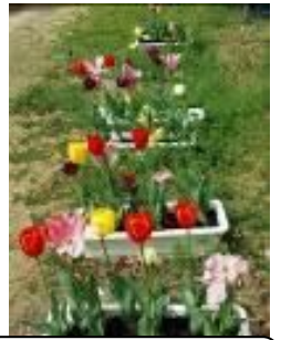
新2年生が球根を植えたチューリップ

校庭の桜が若葉へと装いを変え、春の柔らかな日差しが、子どもたちの新しい門出を祝福しているかのような穏やかな季節を迎えました。保護者の皆さま、お子様のご進級、誠におめでとうございます。