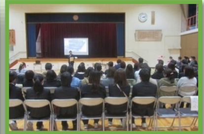
公開授業後の全体会 ↑ 大勢の先生が取組みを聞きにきました。