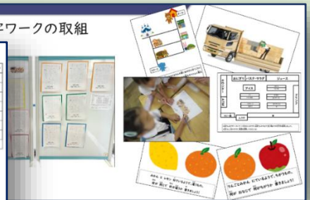
← ↑ 学校の取組み報告の スライドより