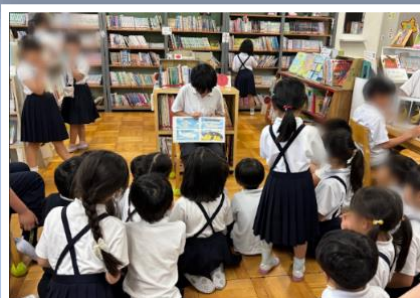
進んで、他学年の児童に読み聞かせをする児童