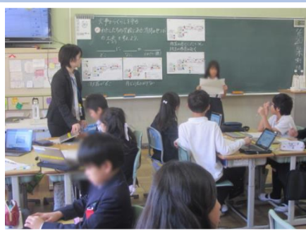
進んで、班で話し合ったことを発表する児童