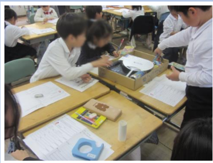
進んで、わかったことをノートに書く児童