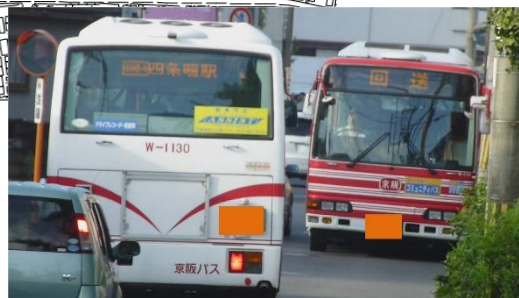
バス離合待ち状況写真