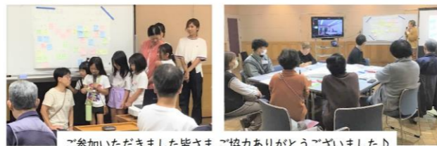
ご参加いただきました皆さま ご協力ありがとうございました♪

第1回と第2回は同じテーマでグリーンホール田原の良いところと課題及びグリーンホール田原の使い方について、第3回はグリーンホール田原の将来像について参加者の皆さまで意見交換を行いました。今回はお子さまにも参加いただき、老若男女幅広い世代の意見を聞くことができました。グリーンホール田原が皆さまの理想により近づける施設となるよう取り組みを行っていきます。