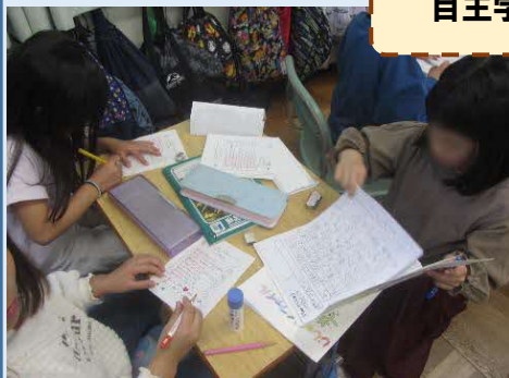
↑自主学習ファイルをめくりながら、メッセージカードに記入する1・2年生のペア