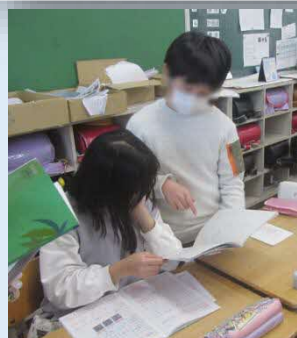
交流会は自主学習のいろいろな方法を知り、メッセージをもらって励まされる機会になりました。

12月初旬、岡部小学校で自主学交流会が行われました。子どもたちは他学年とペアになり、自主学習ノートを見せながら工夫や気をつけたことを互いに説明した後、相手ノートの良かったことや感想をメッセージカードに書いて交換し合いました。交流会は自主学習を見せ合って評価しメッセージを書くことで内容の幅を広げたり、これからの学習につなげていったりすることを目的に、昨年度に続き実施されました。