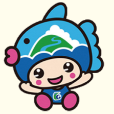
三重県紀北町 マスコットキャラクター きーぼくん

5月15日(水)~6月20日(木) 募集要項を必ず確認のうえ、申請書(地域振興課・田原支所・市民総合センター・市ホームページ上で配布)などを地域振興課へ持参・郵送するかオンライン申請。田原支所・市民総合センターでは受け付け不可。