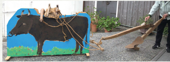
唐犁(牛の模型と唐犁)

そろそろ田植えの季節です。現在では田を耕したり、苗を植えたりするのに大型の機械を使用していますが、昭和35(1960)年ごろより前は、牛や人の力で行っていました。牛に唐犁を取りつけて田を耕し、鍬や鋤などを人が使い畔や溝を作りました。田植えは家族総出の重労働でしたが、植え付け休みに食べるあんころ餅を楽しみに励んだそうです。苗をまっすぐ、等間隔に植えるために、印をつけた縄(田植縄)を使い、5株ずつ植えながら後ろへ下がって植えていきました。不慣れな人や子どもたちはジグザグに植えてしまったそうです。