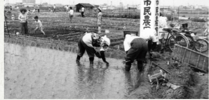
田植えの様子 右下のあぜの上 に田植縄が置か れている(昭和51年)