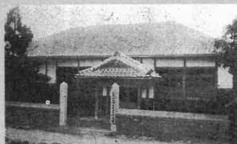
甲可村、四條畷村期の庁舎（大正4年～昭和39年）

るものなり」（四條畷市史第1巻）とあり、四條畷の地名は、四條畷神社名からが正しいと思われ