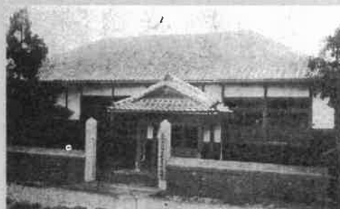
甲可村、四條畷村期の庁舎(大正4年~昭和39年)

るものなり」(四條畷市史第1巻)とあり、四條畷の地名は、四條畷神社名から正しいと思われ