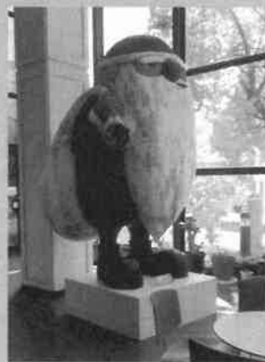
※以前、市民総合センター内に置かれていた大きなサンタ

【行政答弁】これまでの観光施策の展開にあたり、ソフト事業の実施に傾注してきたため、ハード整備を伴う事業は検討を行ってこなかった状況。提案の像に際しては、総合的な観光施策の推進にあたり、今年度内に取りまとめる改訂産業振興ビジョンの視点の1つに置く、市域外から人を呼び込む文化、観光振興のなか、基本的な考え方を整理していく。