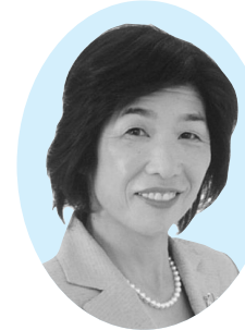
副議長 山下 幸恵

市民の皆様には、平素より、市政並びに市議会の運営に対しまして、格別のご理解とご協力を頂いておりますことに、厚くお礼申し上げます。