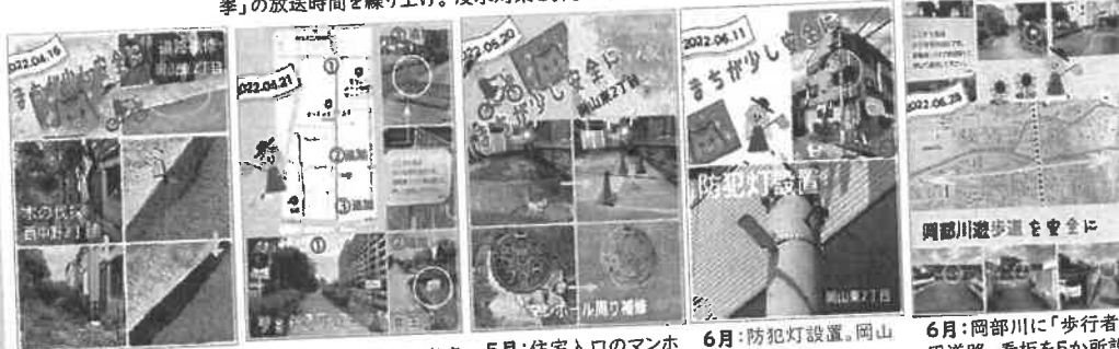
4月:倒木の危険のある木を伐採。西中野2丁目。道路補修。岡山東2丁目。 4月:岡部川に「歩行者専用道路」看板を2か所設置。暇生会病院より西。 5月:住宅入口のマンホール周りを補修。岡山東2丁目。 6月:防犯灯設置。岡山東2丁目。 6月:岡部川に「歩行者専用道路」看板を5か所設置。暇生会病院より東。