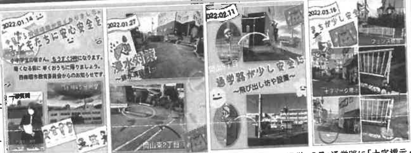
1月:子どもたちに帰宅を呼びかける防災無線の「冬季」の放送時間を繰り上げ。岡山東2丁目。 1月:坂道に排水溝を設置。低地にある住宅への浸水対策を。岡山東2丁目。 2月:見通しの悪い通学路に啓発看板を2か所設置。岡山5丁目。 3月:通学路に「十字標示」設置。岡山5丁目。フェンス修理。岡山東5丁目。

安心安全のまちづくり (2022年1月~6月) 国よからご要望をいただいたうち16件(箇所)の環境整備などができました。一部分をご報告します。