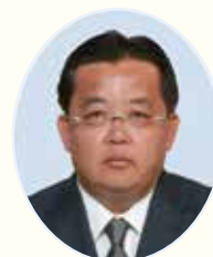
副議長 大矢 克巳