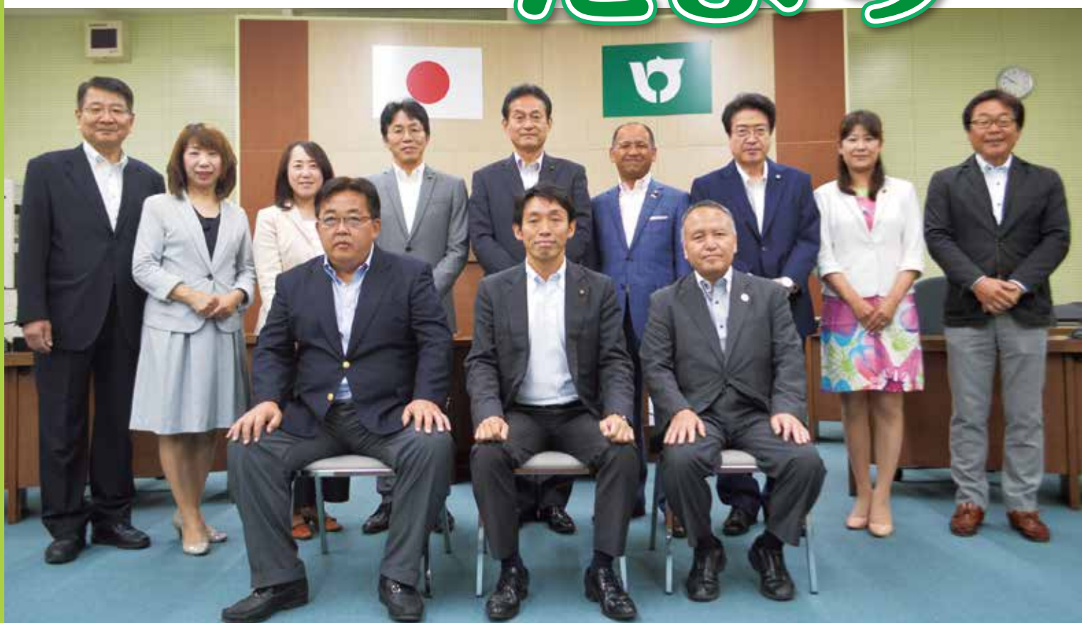
議場にて撮影(平成30年5月24日)