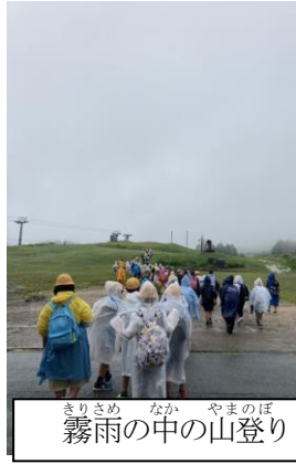
霧雨の中の山登り