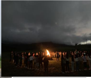
幻想的な空のもとでのキャンプファイヤー