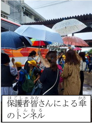
保護者皆さんによる傘のトンネル