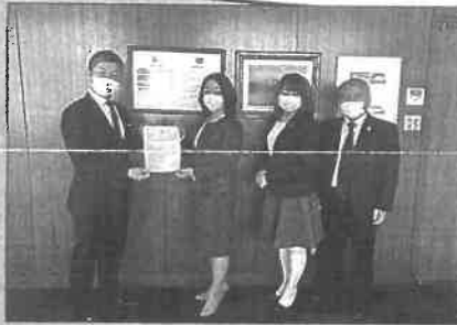
東市長に緊急要望書を提出