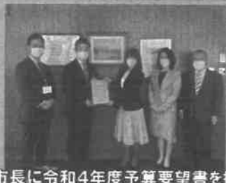
東市長に令和4年度予算要望書を提出