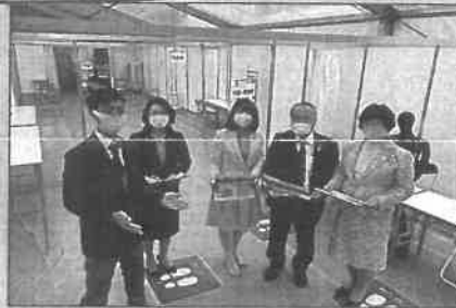
集団接種会場設営を視察