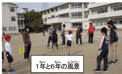
ねん ねん ふうけい 1年と6年の風景

れています。そのなかで、なわとびはマスクしながらでもできる 運動のひとつであります。休み時間も、練習する子どもたちの 姿をよく見かけますし、是非取り組んでほしいと思います。加えて、このような学級活動や高学年と