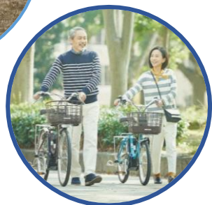
「電動アシスト自転車」