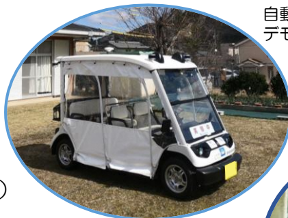
自動運転車 デモンストレーション