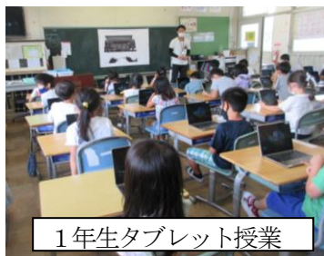
1年生タブレット授業

授業でも少しずつタブレットPCを活用しています。先日は1年生も使ってみました。2学期以降もっと活用していきたいと思っています。また、2学期早々には、自宅への持ち帰りの取組みも考えています。その際は、自宅でのWi-Fi接続やPCの使用、管理について、各ご家庭のご協力のほど、よろしくお願いいたします。