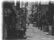
忍ヶ丘本通り商店街