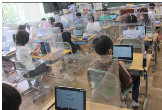
しょうがっこう ぜんいん いっせい ろぐいん じょうす (小学校)全員、一斉にログインする様子

あわ かくがっこう たぶれっと しょうじょうきょう 併せて、各学校でタブレットPCの使用状況や、 かつようこうじれい また、使用を進めていく中での課題 を聞き取りました。