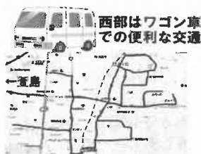
※地図はあくまでイメージです。田原台⇄四条驛駅15分