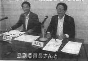
島副委員長さんと