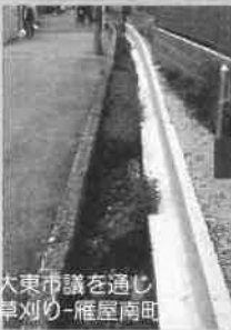
大東市議を通じ 草刈り-雁屋南町