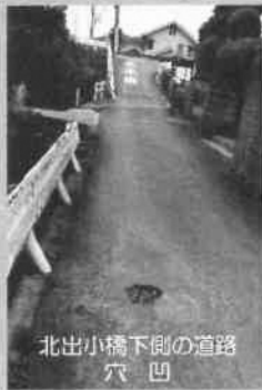
北出小橋下側の道路 穴 凹