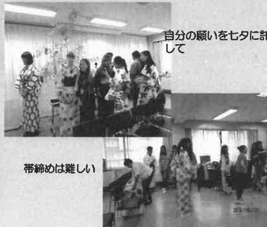
自分の願いをセタに託して