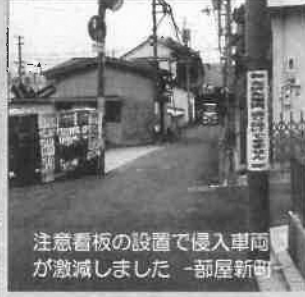
注意看板の設置で侵入車両 が激減しました 一部屋新町