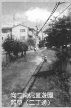
向二南児童遊園 雑草（二丁通）