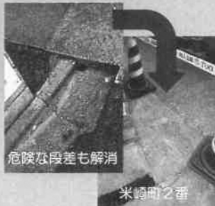
危険な段差も解消